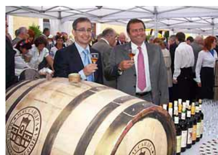
Krim - Vinprovning