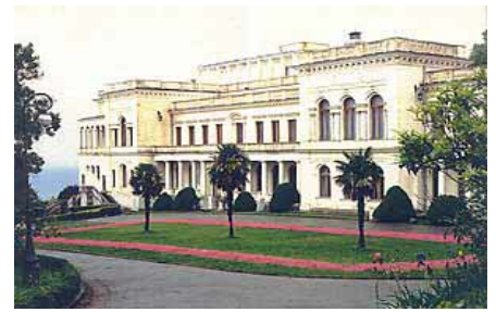
Krim - Livadiapalatset