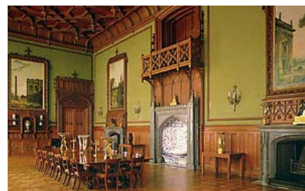
Krim - Vorontsovpalatset