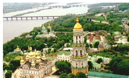
Kiev - världsarvet Pechersk Lavra