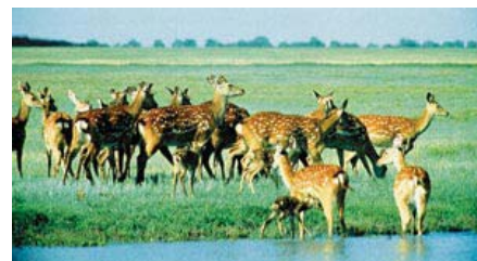
I biosfärreservatet Askania-Nova