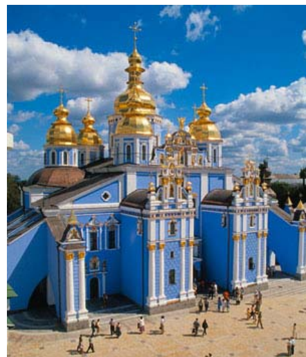
S:t Mikaelsskyrkan i Kiev

Tidig förmiddag besök i Zmiyivka-Gammalsvenskby - möte med invånarna, den tionde generationen av de svensktalande bönder från Estland som deporterades hit i slutet av 1700-talet. 1929 fick 900