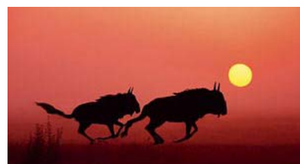
Askania-Nova - bevarad stäpp