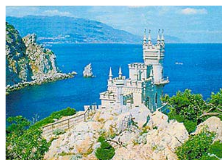
Krim - "Svalboet"