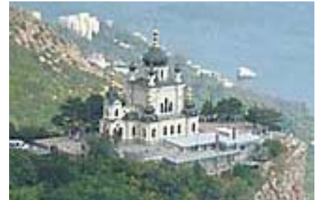
Krim - Foroskyrkan

Baskarta: Wikipedia, får fritt kopieras enl GNU-licens