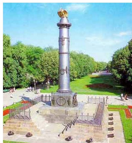
Segermunumentet i Poltava